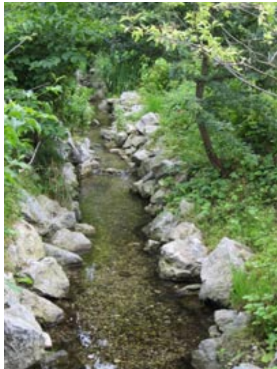
• So könnte das Bachbett bald aussehen