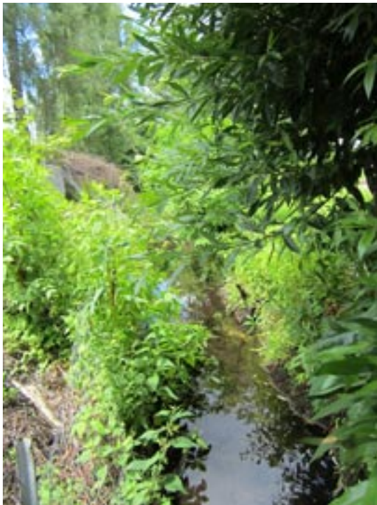
• Das verwilderte Bachbett

Doch das soll sich nun ändern! Die Hänge sollen abgeflacht und das Bachbett gereinigt werden. Mit großen Steinen werden die Ufer befestigt, um anschließend eine der Umgebung entsprechende Bepflanzung am Hang zu ermöglichen. Die Gesamtkosten für die Umgestaltung des Baches belaufen sich auf € 6.000, die der Bauernhofkindergarten unmöglich alleine stemmen kann. ■